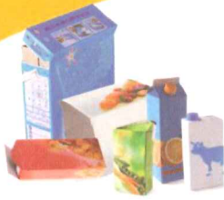
Emballages en carton et briques alimentaires