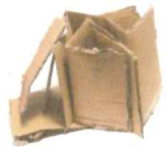
Gros cartons déchirés et réduits en morceaux