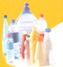
Uniquement bouteilles et flacons en plastique compressés

A partir du 30 juin 2013, les déchets recyclables sont à jeter dans les bacs en vrac et sans sac