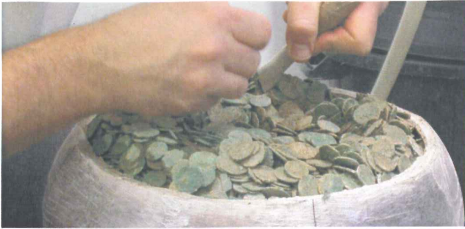
Fouille en laboratoire d'une cruche remplie de monnaies du IIIe s. ap. J.-C. (Pannecé, Loire-Atlantique)

Les archéologues professionnels collaborent avec des spécialistes de nombreuses disciplines pour inventorier, étudier puis replacer dans un contexte historique les traces parfois ténues mais toujours significatives de l'histoire des hommes. La publication scientifique et la valorisation des résultats auprès du grand public sont les objectifs majeurs de la profession car toute intervention sur un site archéologique implique la destruction, par l'étude raisonnée, des vestiges de nature diverse enfouis dans le sol.