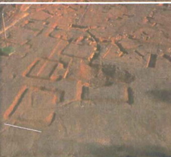
Bibracte, vue de la nécropole de la Croix du Rebut, Tène finale-époque augustéenne, 1998